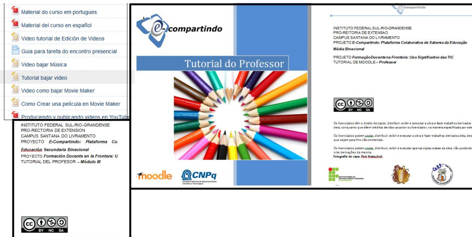
Figura 2 – Materiais REA